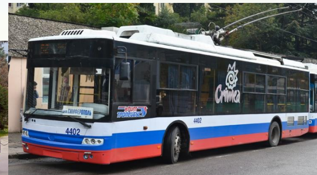
Богдан Т70xxx (трасса)