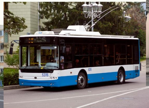
Богдан Т60xxx (город)